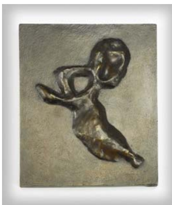
HANS ARP (Strassburg 1886-1966)

CHF 30'000/40'000 EUR 19'500/26'000 USD 24'900/33'200