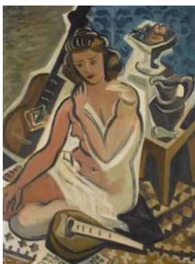
GINO SEVERINI (Cortina 1883-1966 Paris)

CHF 50'000/60'000 EUR 32'500/39'000 USD 41'500/49'800