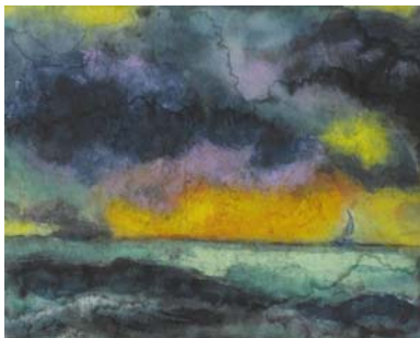
EMIL NOLDE (Nolde 1867-1956 Seebüll)